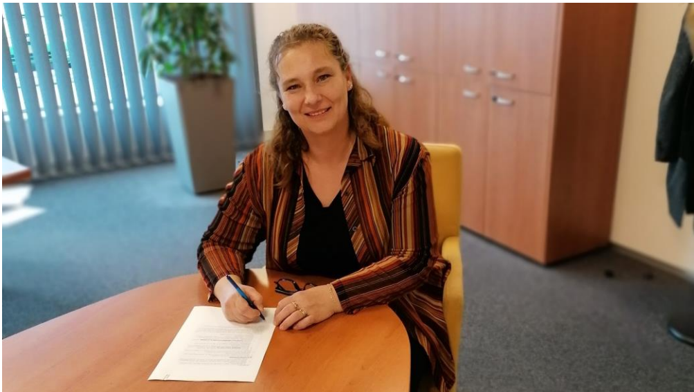
Het ondertekenen van de Statuten

Vanaf dat moment is er een hoop gebeurd. We hebben een website gemaakt, ANBI-status verkregen, een onderkomen gevonden in de Bivak en onze activiteiten flink uitgebreid.